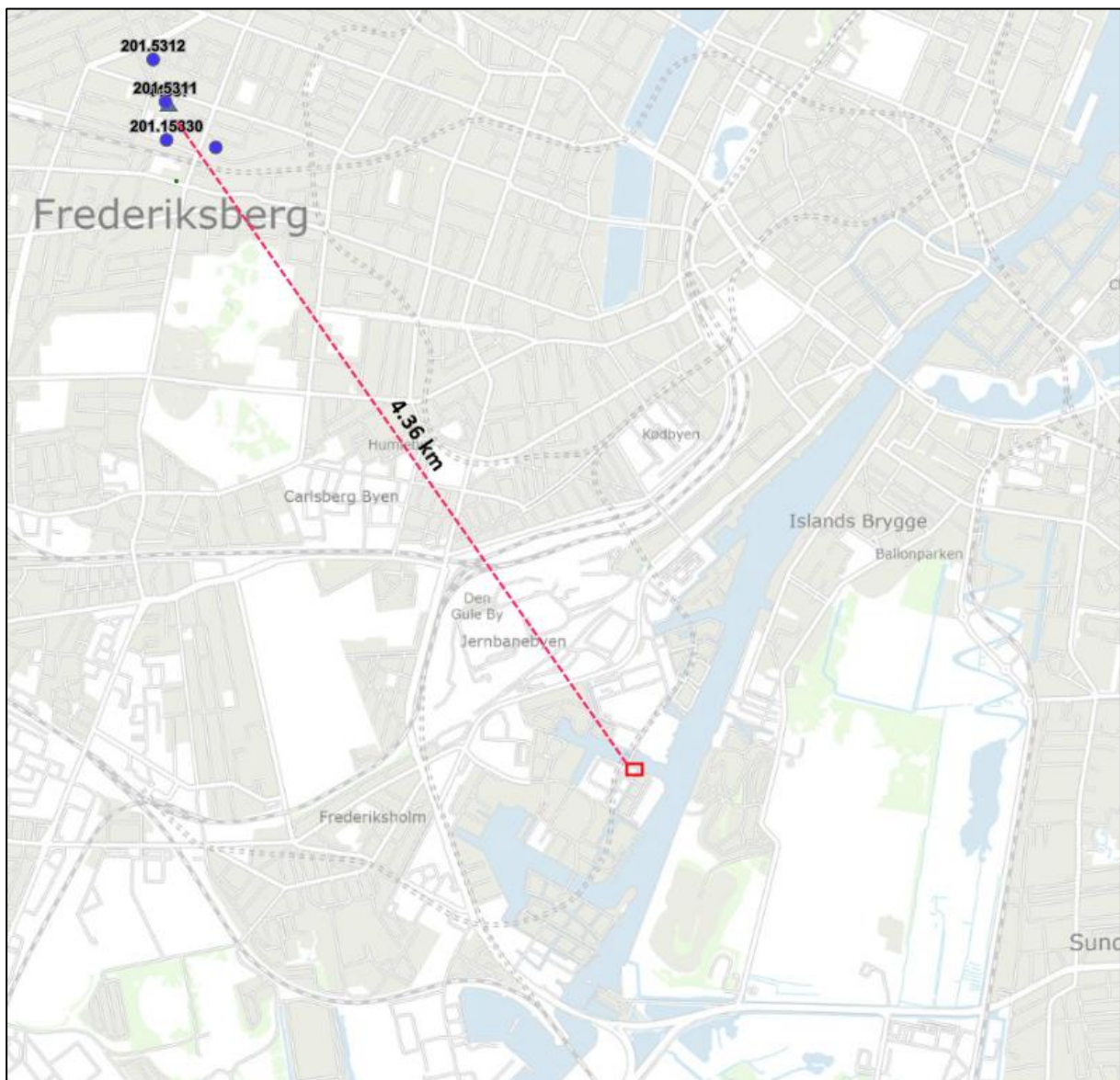
Figur 2: Afstand mellem projektområde og vandindvinding.