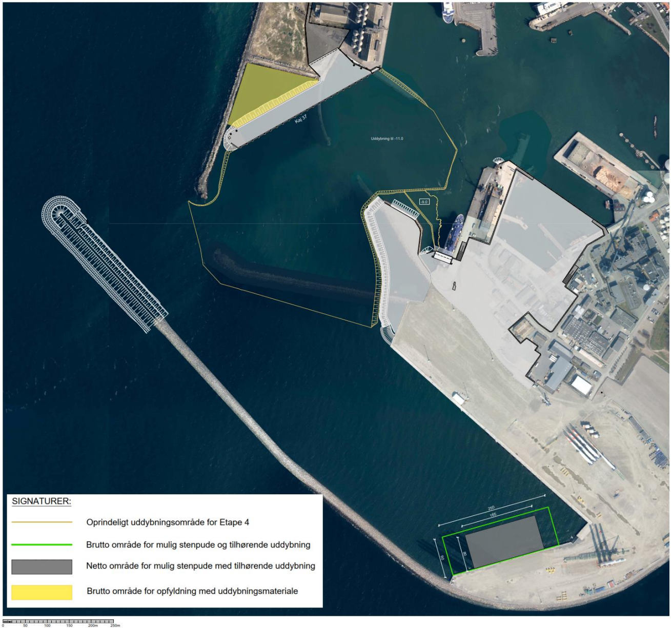
Figur 2.1 Rønne Havn med angivelse af området i industribassinet foran kaj 33 med mulig placering af stenpuden (markeret med grøn linje). Gul linje angiver det område, hvor der er foretaget uddybning i etape 4-udvidelsen af havnen. Gul trekant angiver opfyldningsområde bag kaj 37.