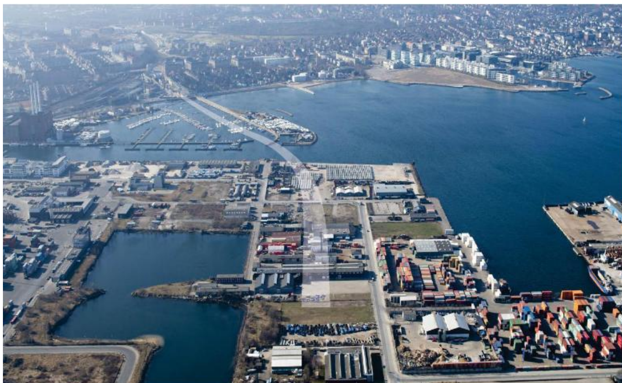
Figur 1: Nordhavnstunnelen, der indtegnet med en mindre gennemsigtig hvid stribe der indikerer placeringen af tunnelen.

Forlængelsen af den midlertidige lukning vil kunne påvirke de rekreative interesser, da udsejlingen igennem Kalkbrænderiløbet i denne periode ikke er muligt. I miljøkonsekvensrapporten belyses projektets påvirkninger på de rekreative interesser ved en midlertidig lukning på 5 måneder.